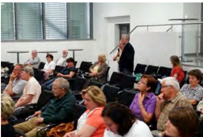
Teilnehmer in der Diskussion