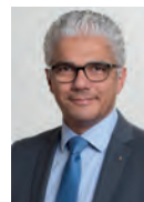
Ashok Sridharan Oberbürgermeister der Stadt Bonn